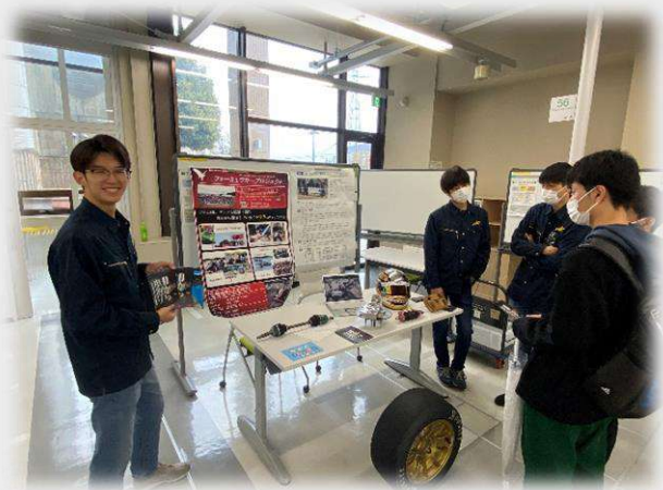
図1:特設ブースの様子